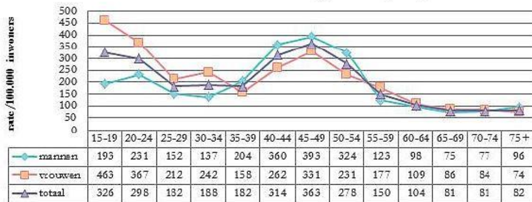
Person-based rates, Groot Gent, 2014, volgens leeftijd en geslacht